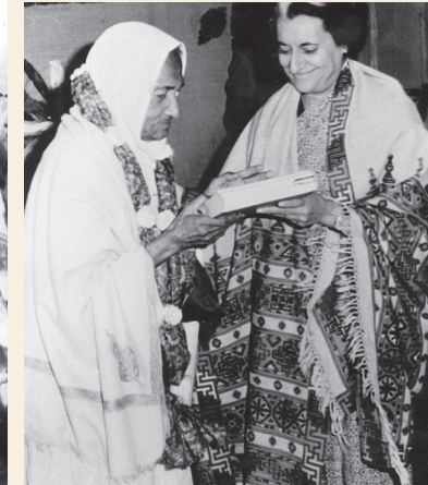
Receiving Commemoration Volume from Smt. Indira Gandhi.