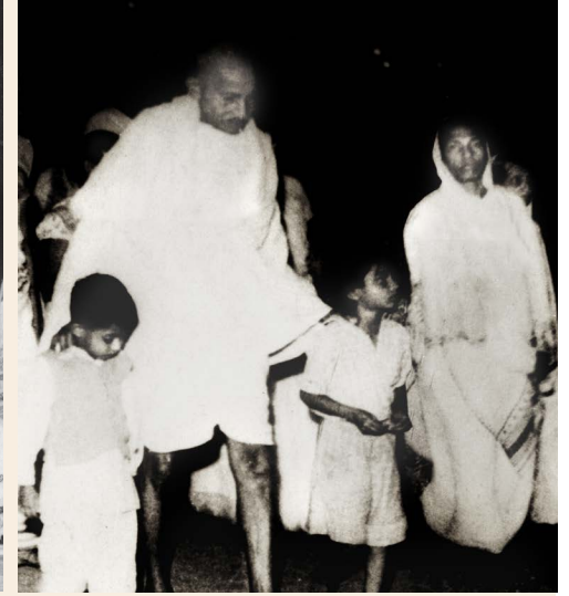
Morning walk with Mahatma Gandhi.