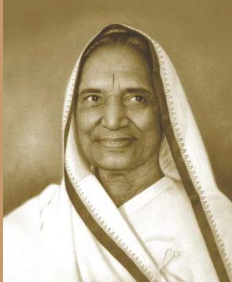
Jankidevi Bajaj 1893-1979