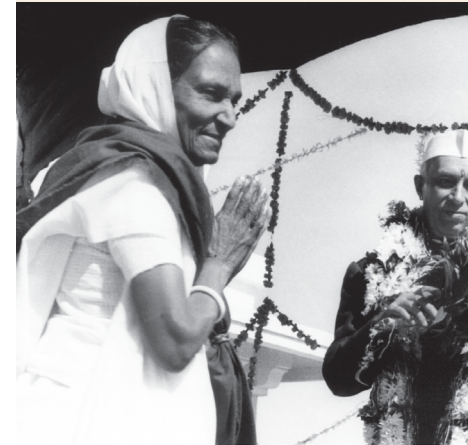
Greeting Pt. Jawaharlal Nehru.