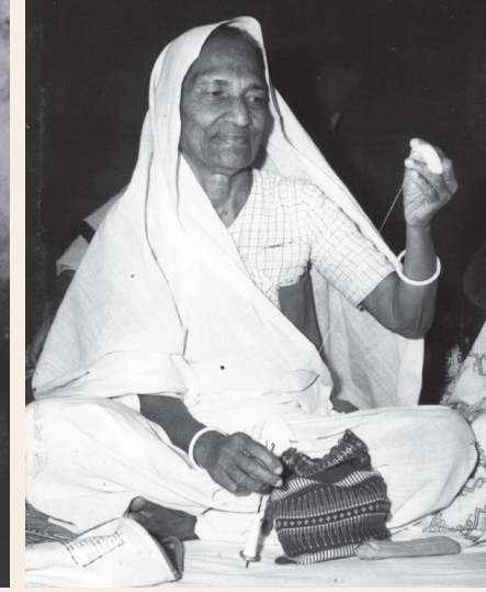
Spinning the 'Taki'.