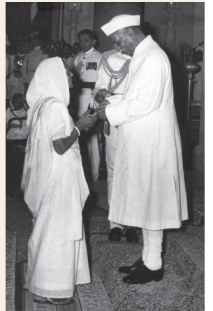
'Padma Vibhushan' being conferred by President Dr. Rajendra Prasad.